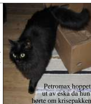
Petromax hoppet ut av eska da hun hørte om krisepakken