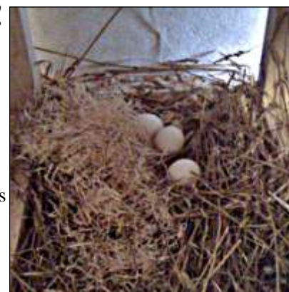
Eggene i verpekassen