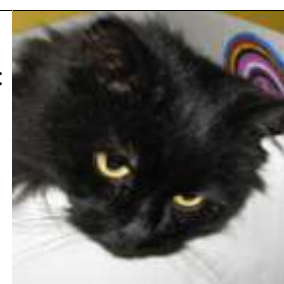
Petro tapte slaget, og lurer på hva hun skal gjøre nå ...

Men katta pønser sikkert ut nye nykker som kan irritere – Red.