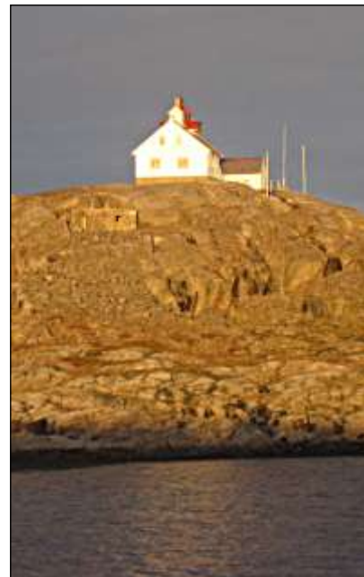
Fyret lyser i sola, selv om det er slokt!