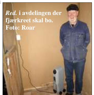
Red. i avdelingen der fjærkreet skal bo.

hus. Det ble innvilget til sammen kr 30 000 fra fylkeskommunen og Storebrand. Det har tatt utrolig lang tid å gjennomføre prosjektet, av flere årsaker; bl.a. mangel på dugnadskapasitet. Men nå er fjosen snart ferdigstilt og skal være klar til medio oktober, da 10 høner og en hane skal flytte inn. Mer i MN 10 09!